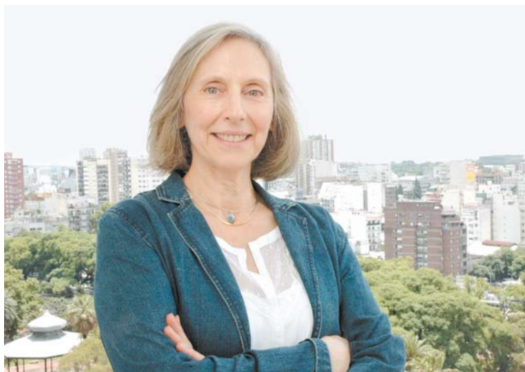
El futuro es hoy - Las diversas imágenes reunidas por Margarita Gutman revelan a la vez imaginación e ingenuidad.

"Si no es posible imaginar y proyectar un mundo por venir, menos