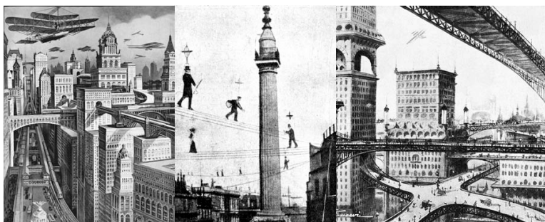
Buenos Aires, la ciudad en 2010 - Puentes en varios niveles, hombres con giróscopos que se desplazan por cables.

-Era un público que sabía leer pero también mirar, porque las publicaciones tenían muchas imágenes. Su consumo era gigantesco y llegaron a tener una circulación casi como los diarios ya que eran muy baratas y chiquitas para ser leídas en el tranvía, el tren, o a partir de 1903 en el nuevo subte. También tuvieron mucho éxito porque estaban dirigidas a toda la familia, aunque luego comenzaron a diversificarse