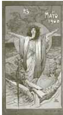
Teófilo Campos Soares Buenos Aires 350 x 263 mm Colección Héctor Lucci.